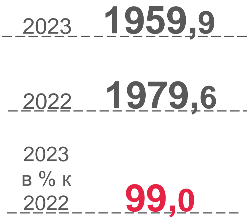
ПОСЕВНАЯ ПЛОЩАДЬ В ХОЗЯЙСТВАХ ВСЕХ КАТЕГОРИЙ, ТЫСЯЧ ГЕКТАРОВ