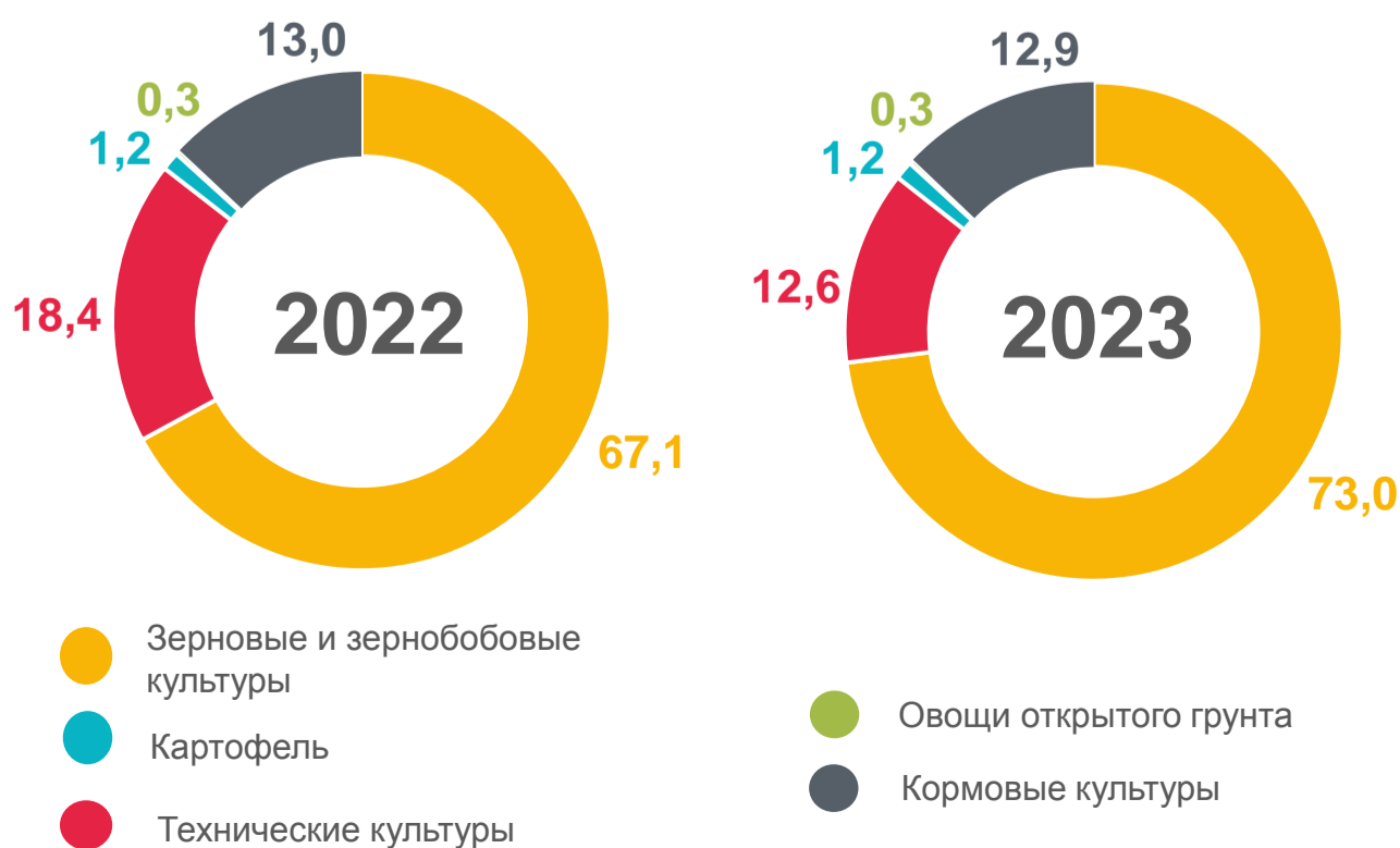
СТРУКТУРА ПОСЕВНОЙ ПЛОЩАДИ ПО СЕЛЬСКОХОЗЯЙСТВЕННЫМ КУЛЬТУРАМ, В ПРОЦЕНТАХ ОТ ВСЕЙ ПОСЕВНОЙ ПЛОЩАДИ